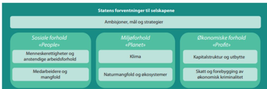
Figur 1: Statens forventninger til selskapene. Kilde: Eierskapsmeldingen Meld. St. 6 (2022-2023)

Spesialisthelsetjenesten har vedtatt et felles rammeverk for samfunnsansvar (sak 026-2023 ). Rammeverket tar utgangspunkt i stortingsmelding 6 Et grønnere og mer aktivt statlig eierskap – Statens direkte eierskap i selskaper (eierskapsmeldingen). Eierskapsmeldingen og rammeverket setter søkelys på tre overordnede samfunnsansvarsområder, som vist i figuren under.