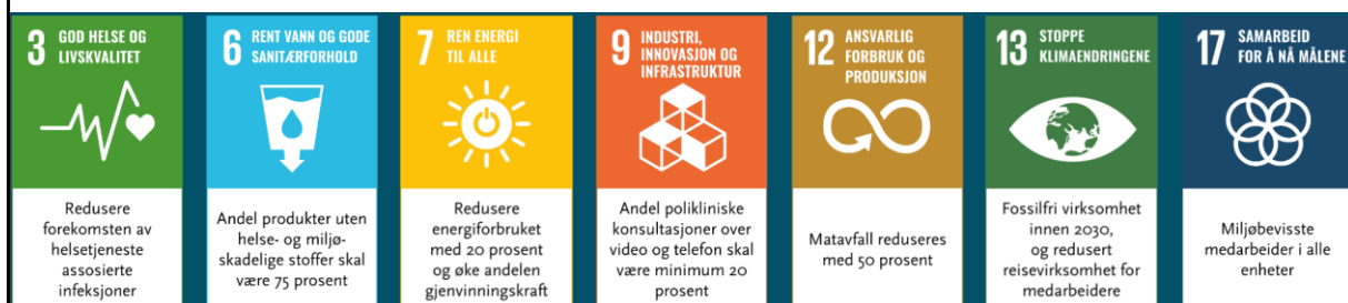
Figur 3: FNs bærekraftsmål og felles klima- og miljømål vedtatt av de fire regionale styrene.

Sykehuspartner HF er også sertifisert i henhold til NS-EN ISO 14001:2015 .